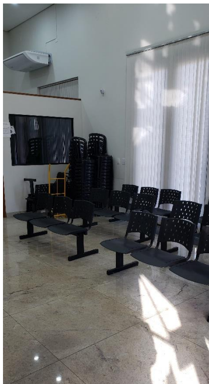
Atendimento ao Público