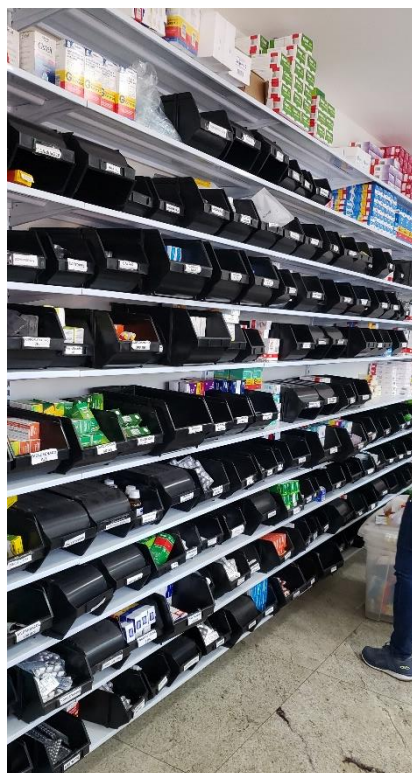
Guarda dos Medicamentos