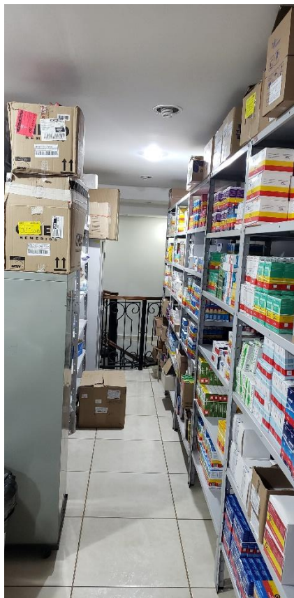
Guarda dos Medicamentos