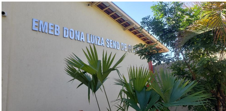
Fachada da Escola