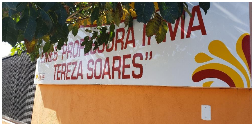
Fachada/Entrada da Escola