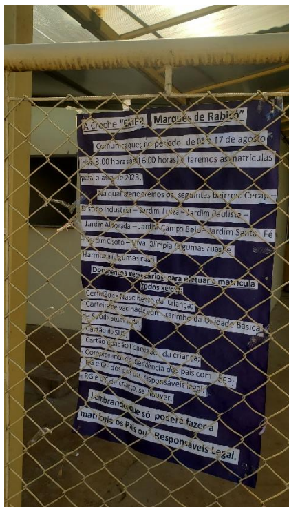
Entrada da Escola