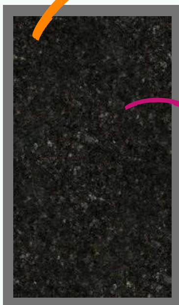
Granito Verde Ubatuba (pia esculpida e prateleira)