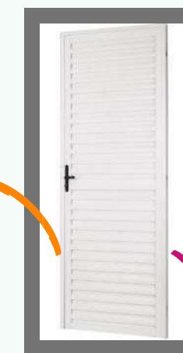
Porta de Alumínio