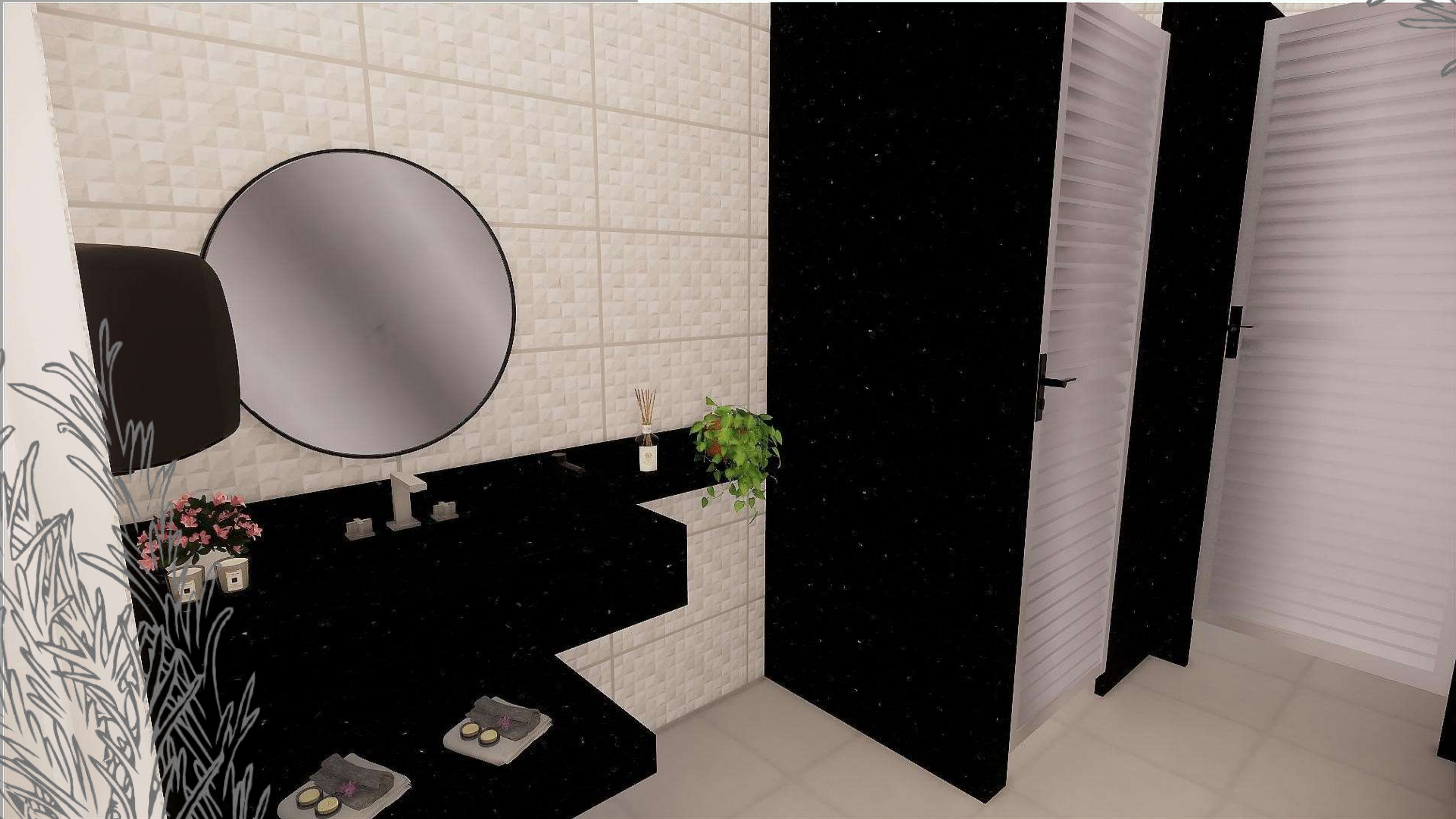
Banho Feminino Interno