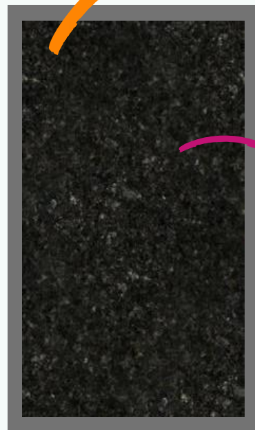
Granito Verde Ubatuba (pia esculpida e prateleira)