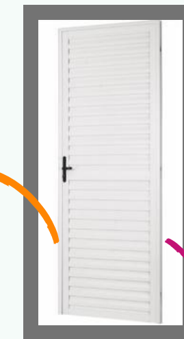
Porta de Alumínio